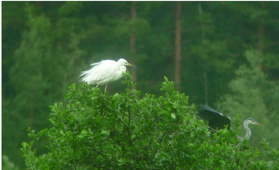
Yksi kirjoittajalle parhaimmista vuoden 2012 retkille vastaan sattuneista lajeista oli jalohaikara. Kuvassa Haminan Lupinlahden lintu 19.7.2012 (kuvattu kaukoputken läpi).