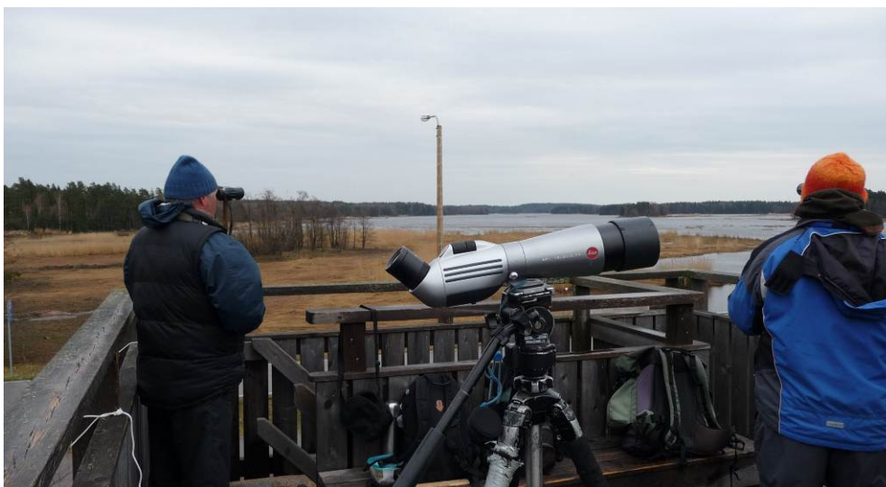
Tornien taistoa Haminan Lupinlahdella 5.5.2012. Kun taistoon saapui pyörällä, ekopinnoihin tuli mm. niittysuohaukka.

Pyöräily Kymnlinna: Harmaasiippo eko 123. Paluu Hovinsaari ja huippuyllätys rantakurvi eko 124 ja vielä lapinkirvinen eko 125. Aurinkoinen ja melko lämmin päivä.tekstiä