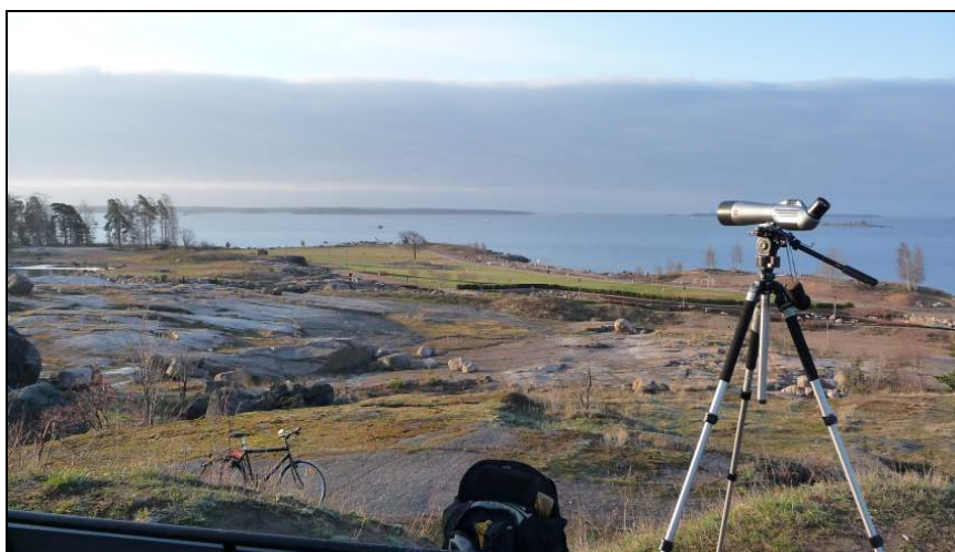
Ekoretkellä Kotkan Meripuistossa 3.5.2011

Tyhjä ruutu tarkoittaa, että väliaikatilanne puuttuu