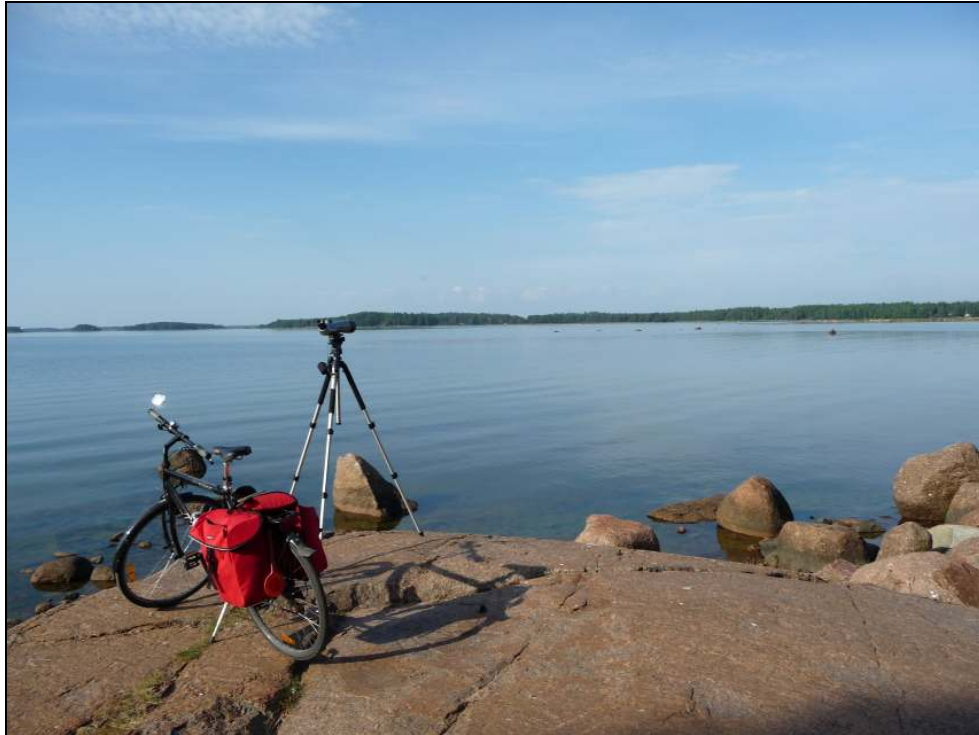
Kuva: Ekopinnakisoissa retkeillään paljolti pyörällä. Kuva kirjoittajan ekoralliretkeltä 6.8.2011 Haminan Vilniemestä.